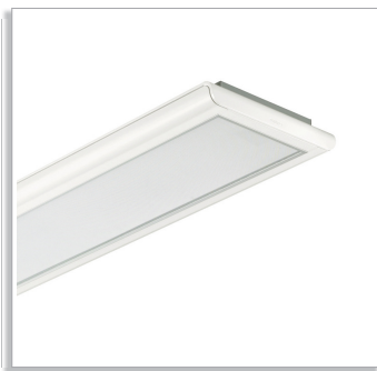
SmartForm TCS461 surface-mounted luminaire with PMMA micro-lens optic (AC-MLO)