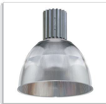
Unibay НРК188 светильник для высоких пролетов с акриловым плафоном, диаметр 569 мм