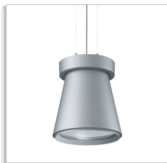
UnicOne Pendant BPK561 компактный светодиодный светильник с широким световым пучком