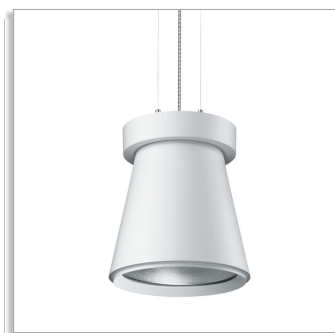
UnicOne Pendant BPK561 компактный светодиодный светильник с широким световым пучком